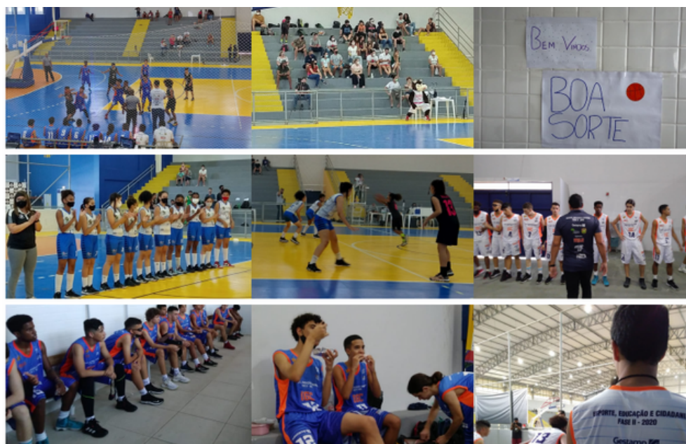
Segunda Etapa do Campeonato Metropolitano 2021