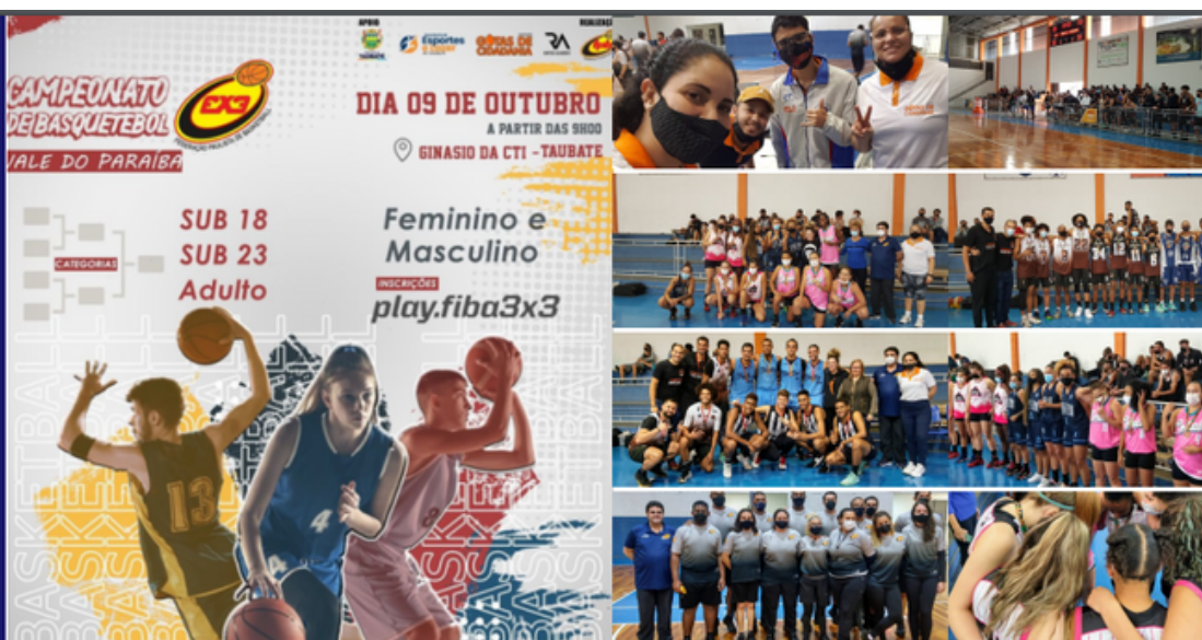
Evento da Federação Paulista de Basketball realizado pelo Instituto Gotas de Cidadania, mais de 350 participantes.