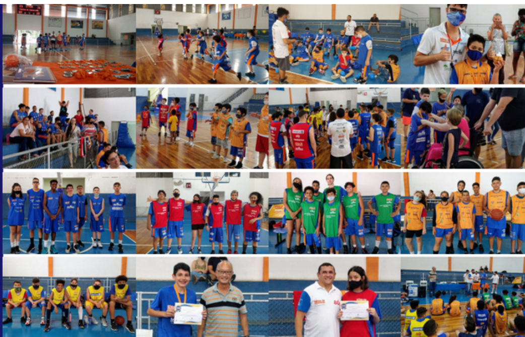
Entrega dos Certificados de Conclusão do Projeto